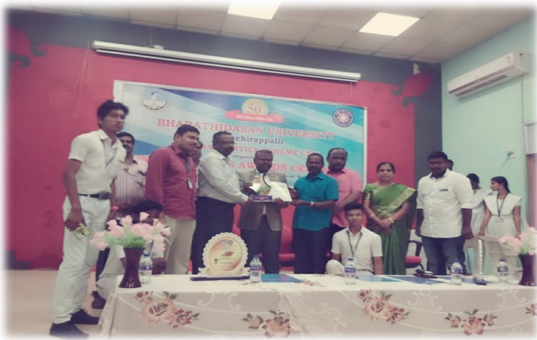
Best NSS College Award from BDU