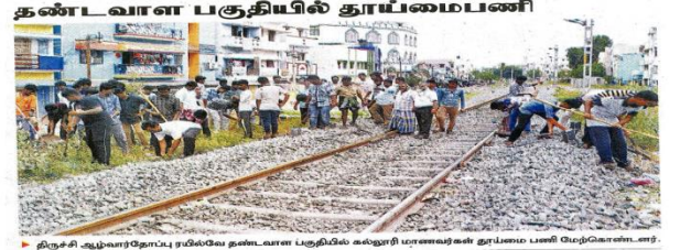
திருச்சி ஆய்வர்தோட்டத்தில் தண்டவாள பகுதியில் கல்லூரி மாணவர்கள் தூய்மை பணி மேற்கொண்டனர்.

CHILMARK BASED Kulima Group Bank Kulima Group Bank ZAM ZAM REAL ESTATE