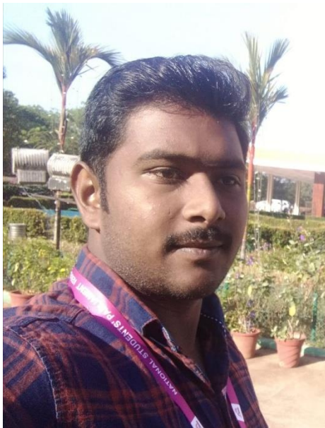
D. MAHA VISHNU